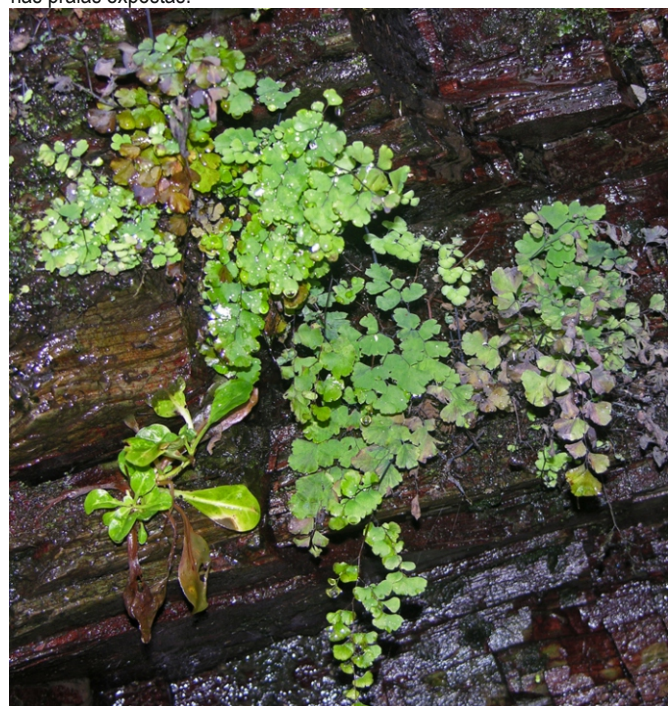
Nas fendas húmidas dos cantís da costa cantábrica galega podemos atopar o fento capilaria ( Adiantum capillus-veneris ), un representante escaso da flora de tempos máis cálidos, moi común como planta ornamental.

É un importante punto de residencia e invernada de aves acuáticas de marisma e rochedos e acolle especies vexetais pouco comúns como o endemismo cantábrico Cochlearia aestuarica , nas áreas de marismas, e o fento capilaria ( Adiantum capillus-veneris ) nas fendas húmidas dos cantís.