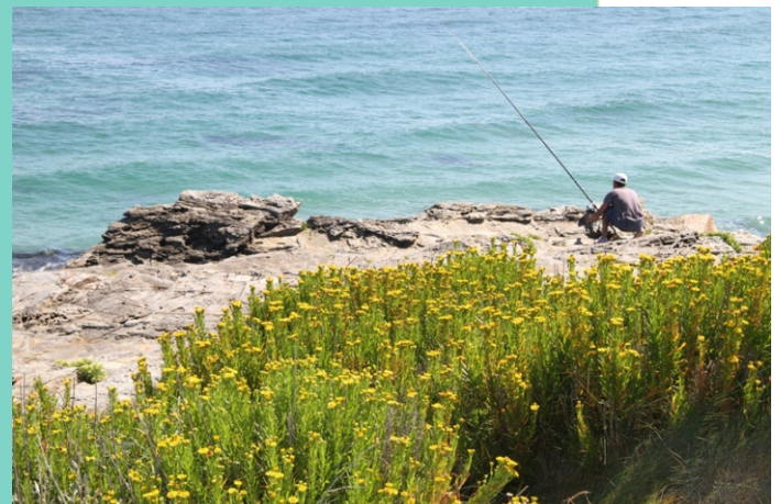
Inula crithmoides nos cantís.