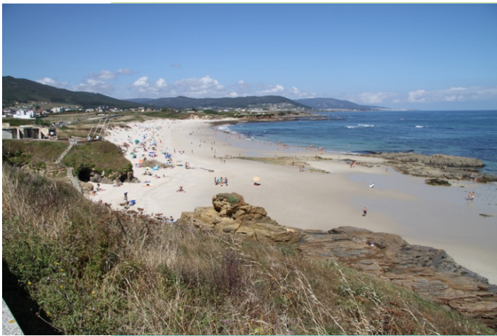
Praia de Llas (760 metros de lonxitude)