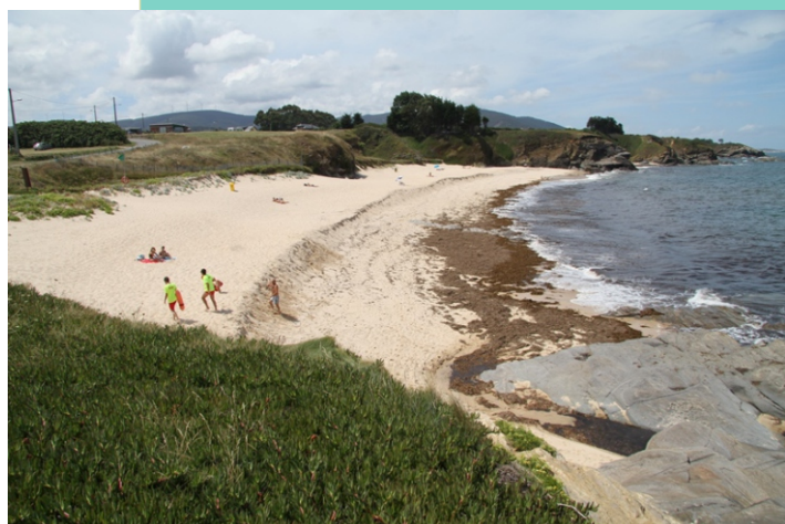
Praia de Area da Fame