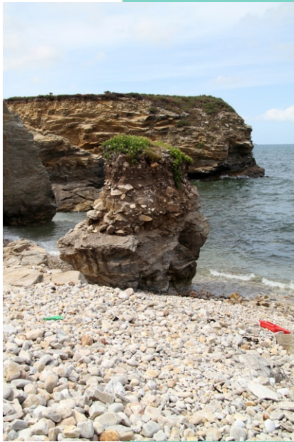
Cantís e coído dos Castelos