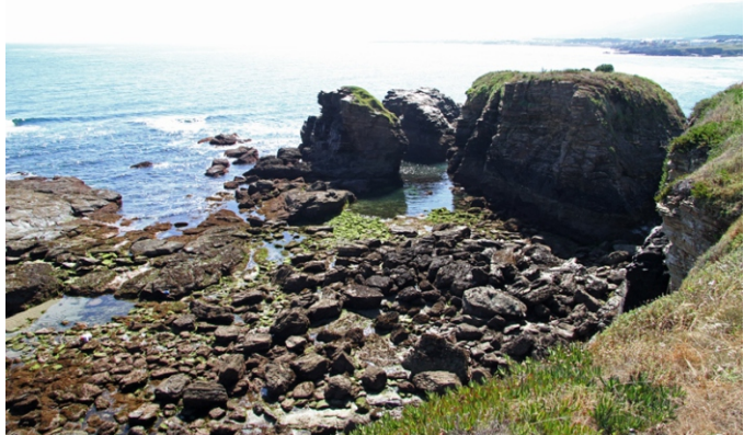
Punta dos Castelos

Praia da Rapadoira, na banda oeste da ría de Foz. De 340 m de lonxitude e 100 m de largor medio, abrigada e de area fina. Os areais desta ría están moi alterados pola construción de espigóns. A vila de Foz é de orixe fenicia. Conta con case 10.000 habitantes e no verán convértese nun importante foco de atracción turística.