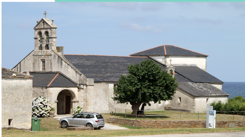
Igrexa e moreira, en Cangas de Foz.