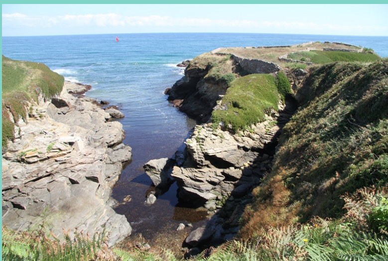
Penas de Llas

Volver dobraría a distancia e o tempo invertido aínda que se se fai pola beira da estrada é un pouco máis curta. Pero a mellor maneira de aforrar a volta e conseguir un transporte ao punto de inicio da ruta deixando o noso coche onde pensemos rematala.