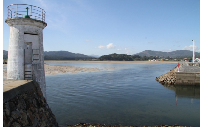
O porto de Foz coa ría ao fondo.