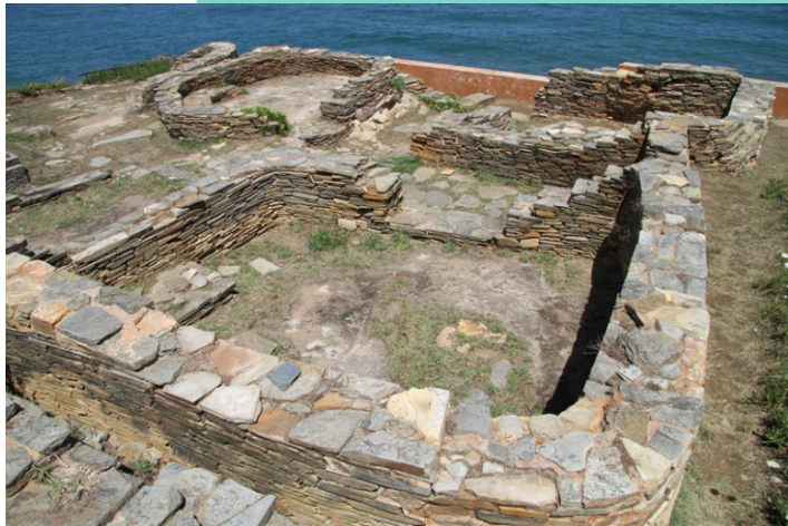
Castro de Fazouro. Nas escavacións atopáronse cunchas de ostras, vieiras, mexillóns, percebes e berberechos, así como anzois e pesos para redes.