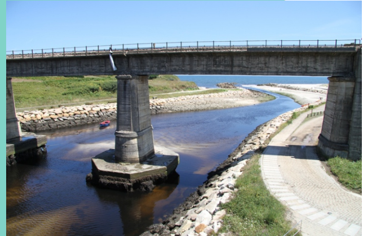
Ría de Fazouro. O río Ouro forma unha ampla marisma e unha pequena ría moi colmatada, pechada pola barra areosa da praia da Pampillosa.