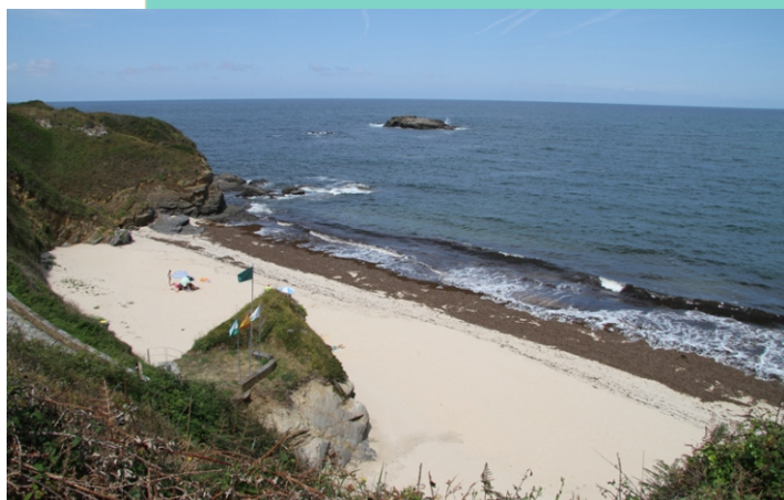
Praia dos Xuncos