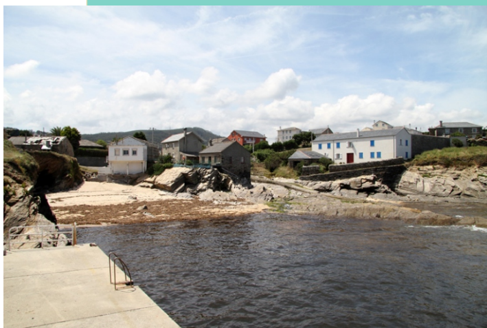
Porto de Nois