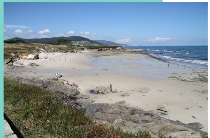
Praia de Peizás (540 m de lonxitude)