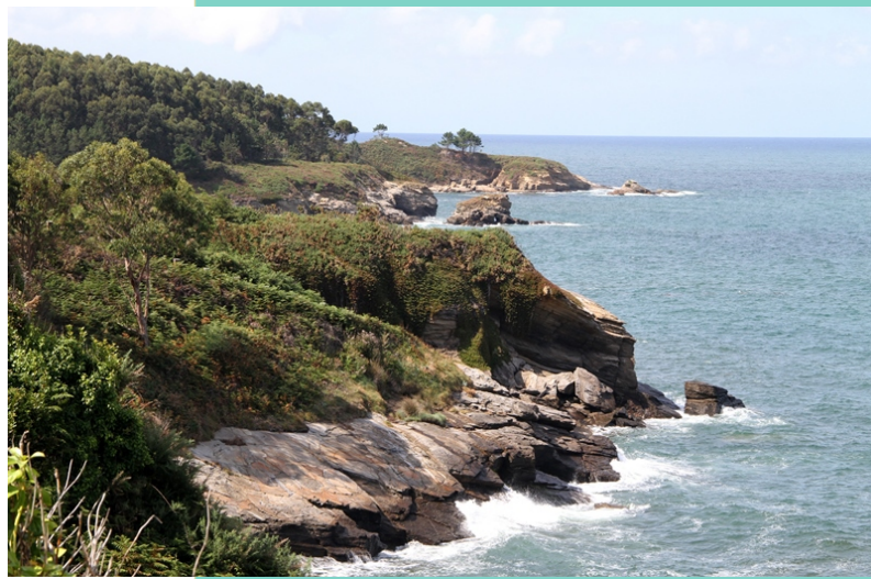
Vista desde Cangas de Foz cara ao oeste.