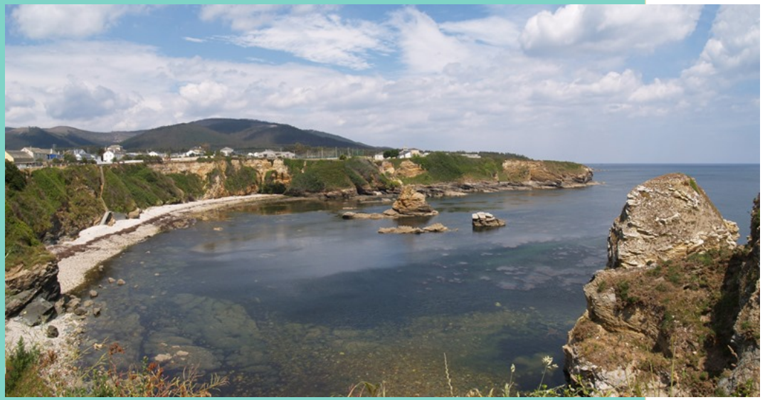
Praia de San Pedro, en Cangas de Foz.