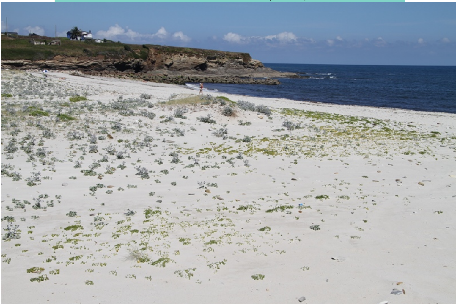
Praia da Pampillosa. Acolle un bo sistema dunar no que medran especies típicas dos areas.