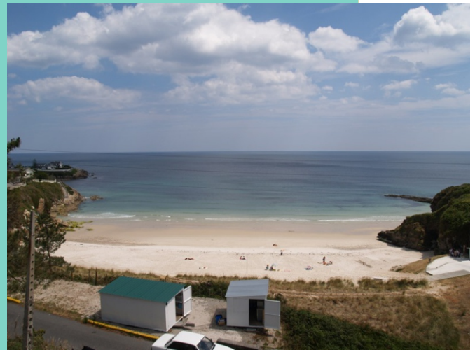
Praia de Areoura, un pequeno areal abrigado no linde de Foz con Burela.