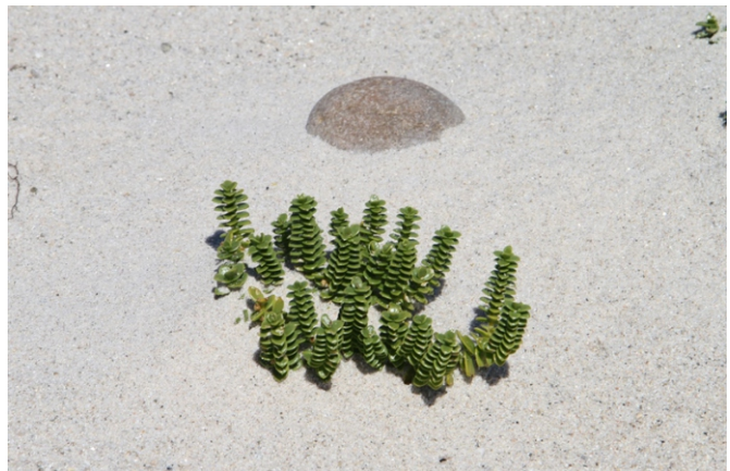
Arenaria do mar ( Honkenya peploides ), a primeira colonizadora da area nas praias expostas.

A costa do concello de Foz é unha sucesión de cantís e praias interrompida polas desembocaduras de varios ríos que forman esteiros e rías. Forma parte da chamada “rasa” ou chaira litoral inclinada que se estende por toda a costa cantábrica. Comeza na ría que forman os ríos Masma e Centiño e o rego de Esteiro, unha ría en forma de funil (máis aberta na saída ao mar que no seu fondo) rodeada de xistos e areíscas e protexida como LIC (ZEC) e ZEPA co nome de “Foz-Masma”, que inclúe o interior da ría e a praia da Rapadoira. Volve a interromperse na desembocadura do Ouro, na pequena ría de Fazouro, no LIC “Río Ouro” que inclúe o esteiro do río, a praia da Pampillosa e a do Serrido; e remata na praia de Areoura, no linde con Burela.