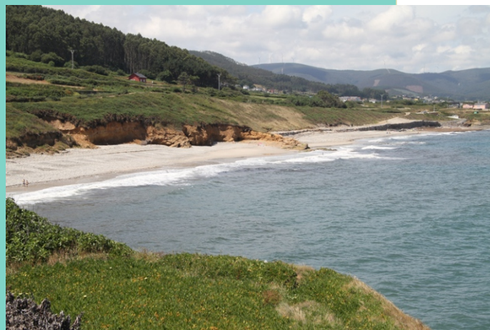
Praia Area Longa desde Fazouro. Mide 850 m de lonxitude e 21 m de largor medio. É unha praia moi batida polo vento e a ondada.