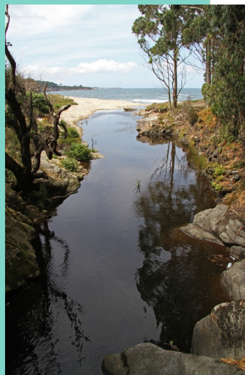
Desembocadura do río de Moucide ou Alemparte