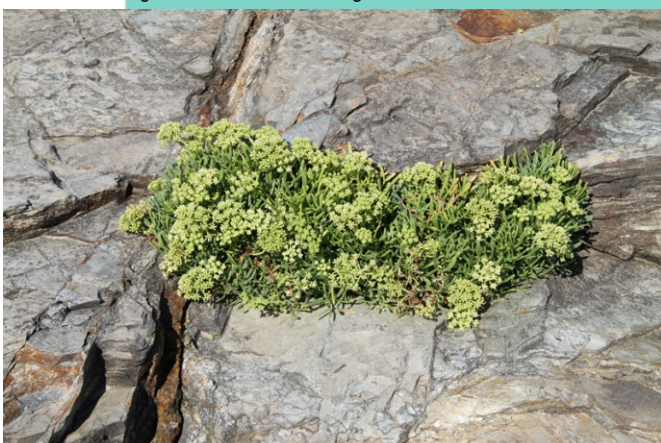
Pirixel do mar ( Crithmum maritimum )